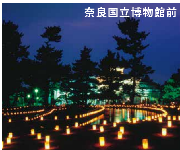
奈良国立博物館前