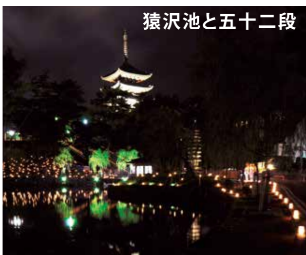
猿沢池と五十二段