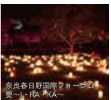
奈良春日野国際ろうそく祭り