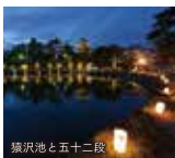
猿沢池と五十二段